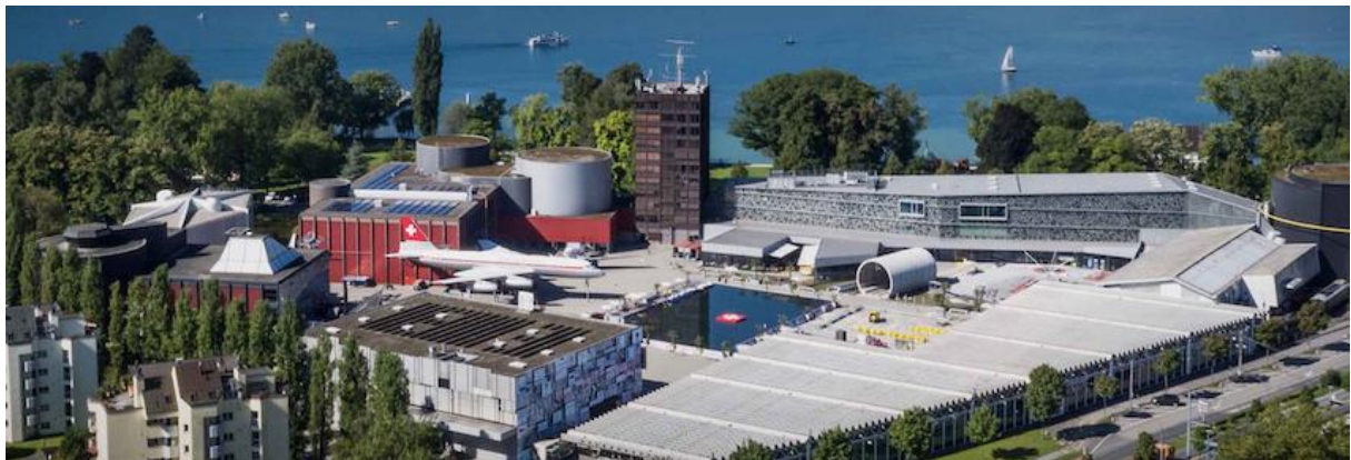
Das Verkehrshaus in Luzern ist das meistbesuchte Museum der Schweiz.

Wer will kann mit der ganzen Familie anreisen und den Besuch bei der HOF mit einem Eintritt ins Verkehrs- und Kommunikationsmuseum verbinden. Das Verkehrshaus ist das meistbesuchte Museum der Schweiz und zeigt eine grosse Sammlung von Lokomotiven, Autos, Schiffen und Flugzeugen. Neben dem Museum beherbergt das Verkehrshaus auch ein Planetarium, das «Filmtheater» und das «Swiss Chocolate Adventure».