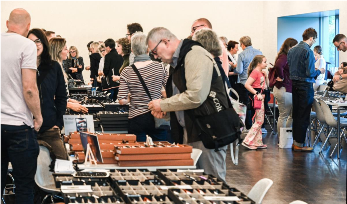
@Hall of Frames GmbH

Steinhausen, 6. Mai 2025 – Die Hall of Frames (HOF) findet am 14. September 2025 erneut im Verkehrshaus Luzern statt. Rund 40 nationale und internationale Brillenbrands haben ihre Teilnahme bereits bestätigt – ein klares Signal für die Relevanz dieser Tischmesse innerhalb der unabhängigen Augenoptikbranche der Schweiz.